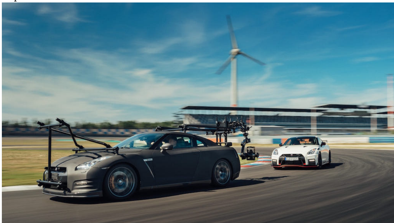
Nissan GT-R e Nismo