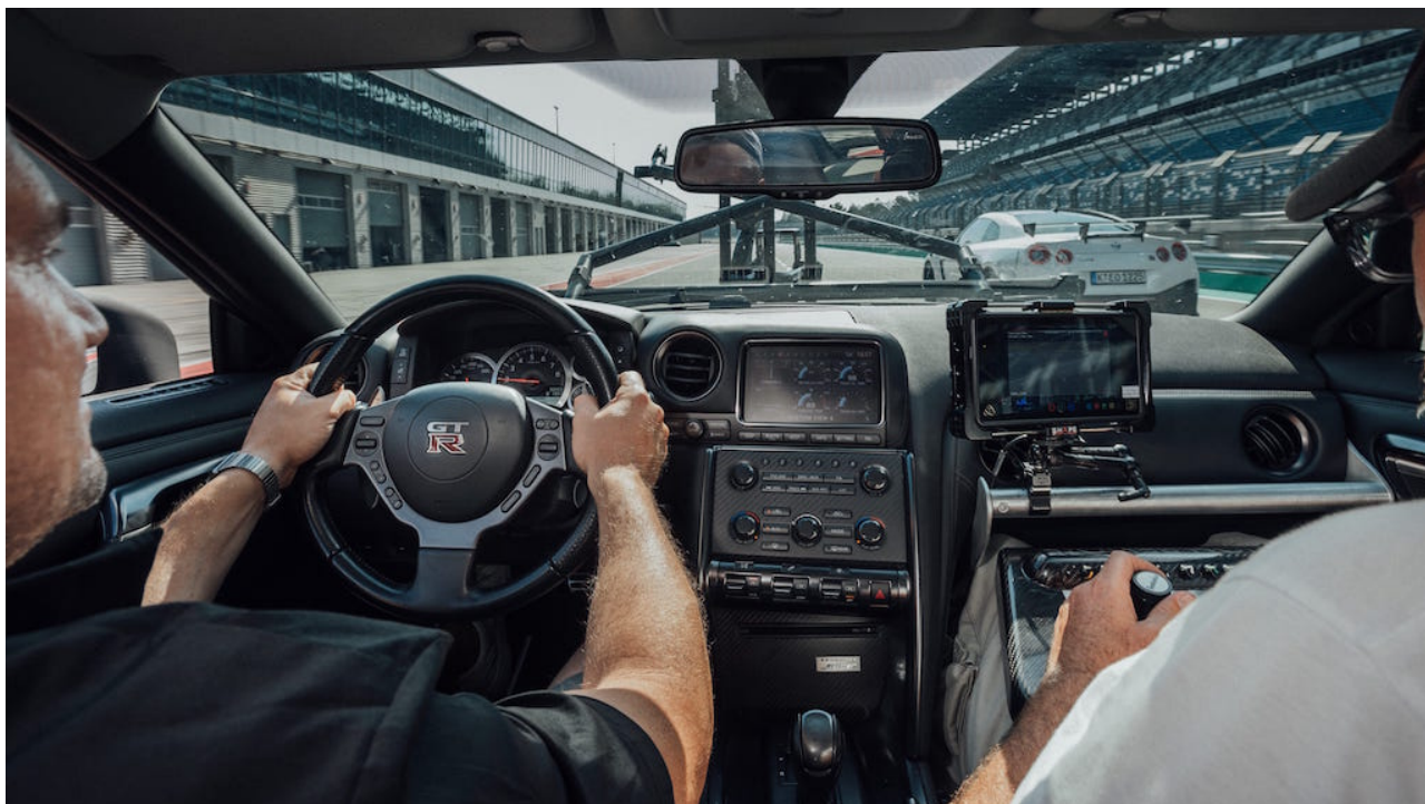
Dentro Nissan GT-R