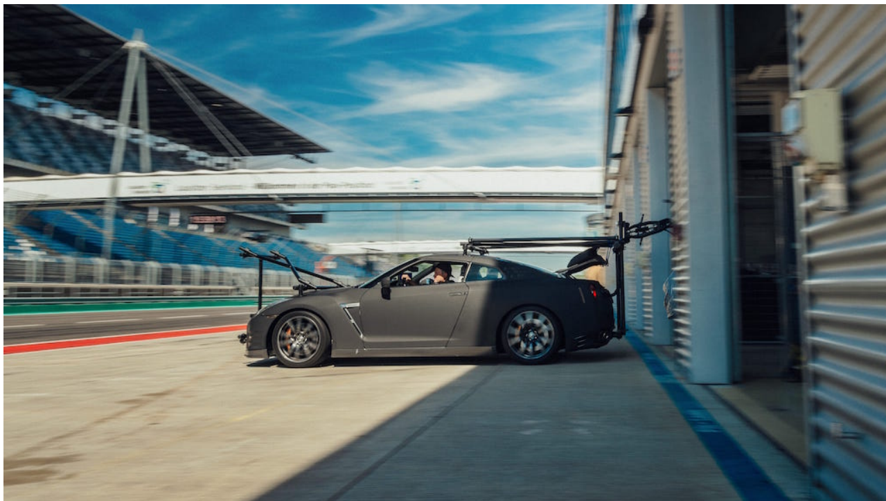
• Pronti al test