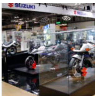
Suzuki Katana Eicma

Parlando della Suzuki KATANA , la moto dispone di un telaio, rigido e leggero proprio come una lama, si presenta particolarmente adatta alla guida in città. Il tutto in virtù della sua posizione leggermente eretta, che le conferisce agilità e stabilità in curva grazie anche al supporto dell'ABS di ultima generazione e del controllo elettronico della trazione. A questo si aggiunge un motore Euro 4 da 150 CV derivato dalla famiglia GSX-R.