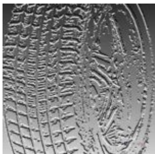
Pneu Chrome effect