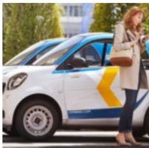
Car sharing Car2Go