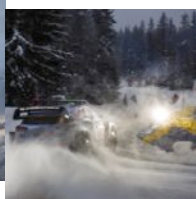
Rally di Svezia