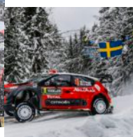
Citroën WRC Svezia