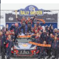
Hyundai ai vince Rally