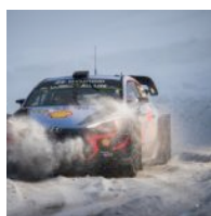
Hyundai ai Motorsport