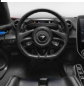
Interno McLaren Senna