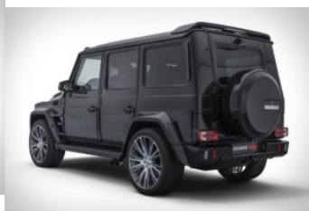
AMG Brabus Classe G