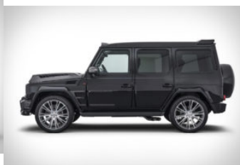
Classe G 900 CV