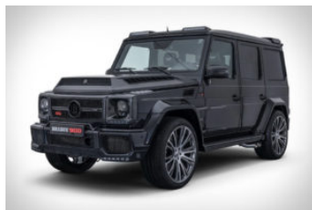
Brabus 900 SUV