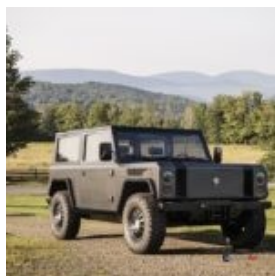
Bollinger B1 4x4