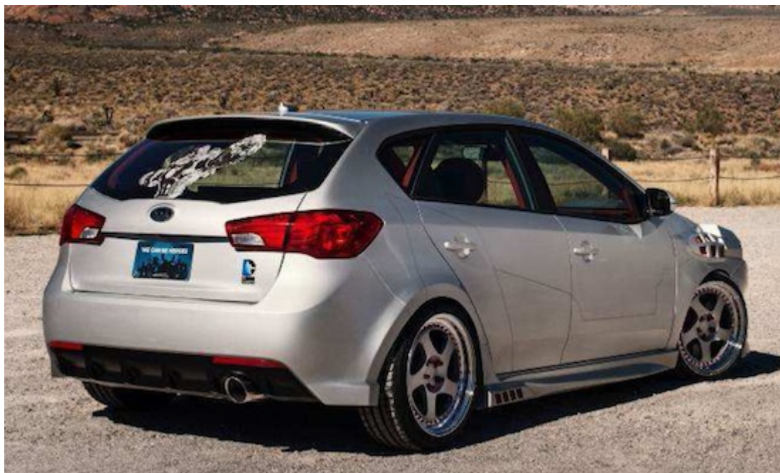
Cyborg Forte 5

riprende infatti tutti i tratti iconici del poliziotto intergalattico: il nero come colore di base a contrasto con i dettagli di un verde brillante e il logo della Lanterna Verde presente sia sui cerchi che all'interno dell'abitacolo