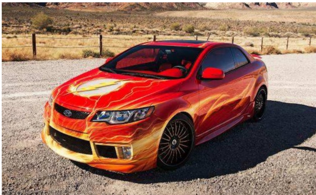
Flash Kia Forte

Batman Kia Optima SX Limited - Il Giustiziere di Gotham City rivive in questa berlina dal carattere sportivo i tratti del Cavaliere Oscuro: il tono dark della carrozzeria, il simbolo iconico del pipistrello sulla griglia "Tiger Nose", si fondono insieme per l'occasione ricreando, grazie anche ai gruppi ottici gialli, il Bat-segnale.