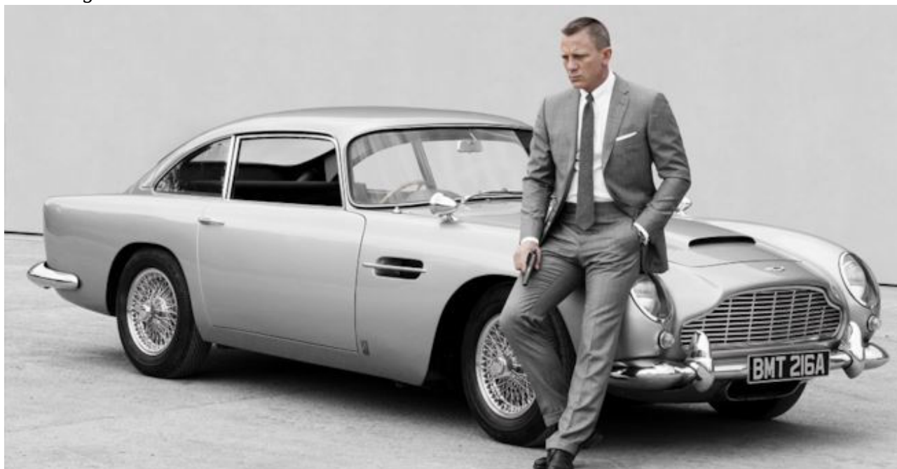
• Aston Martin DB5 007