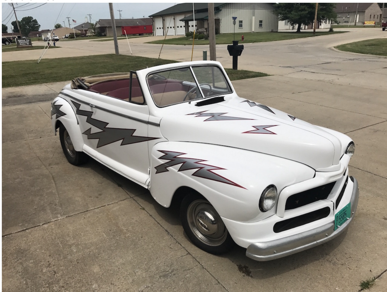
• Greased Lightning