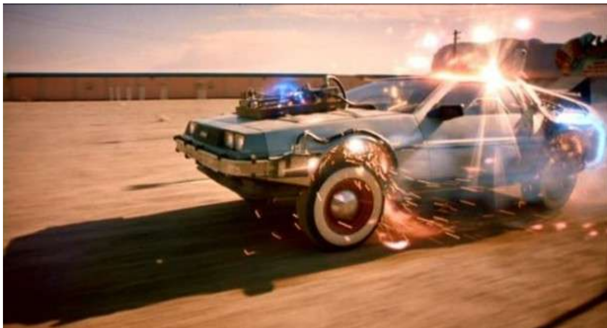
• DeLorean DMC-12