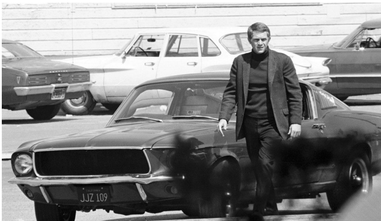
• Mustang GT 390