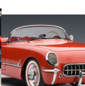
Arriva anche rossa