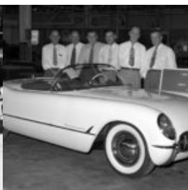
Prima foto e festa