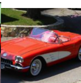
Nel Film True Lies