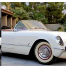
E' nata una leggenda