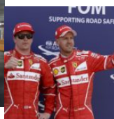
Con Sebastian Vettel