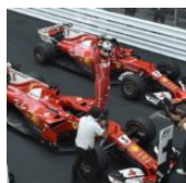
Ferrari GP Monaco