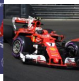
La sua Ferrari numero 7